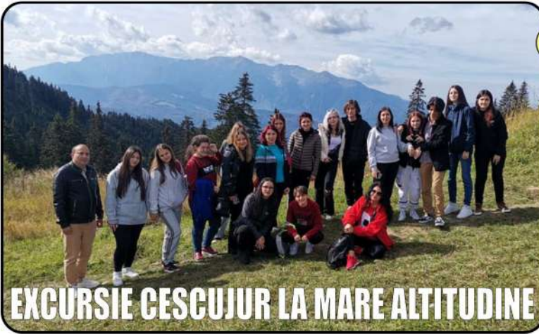
EXCURSIE CESCOJUR LA MARE ALTITUDINE